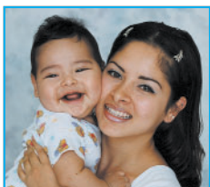
Antes de las vacunas: