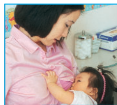
Después de las vacunas: