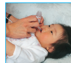
Cuando llegue a casa: