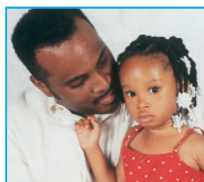
Durante las vacunas: